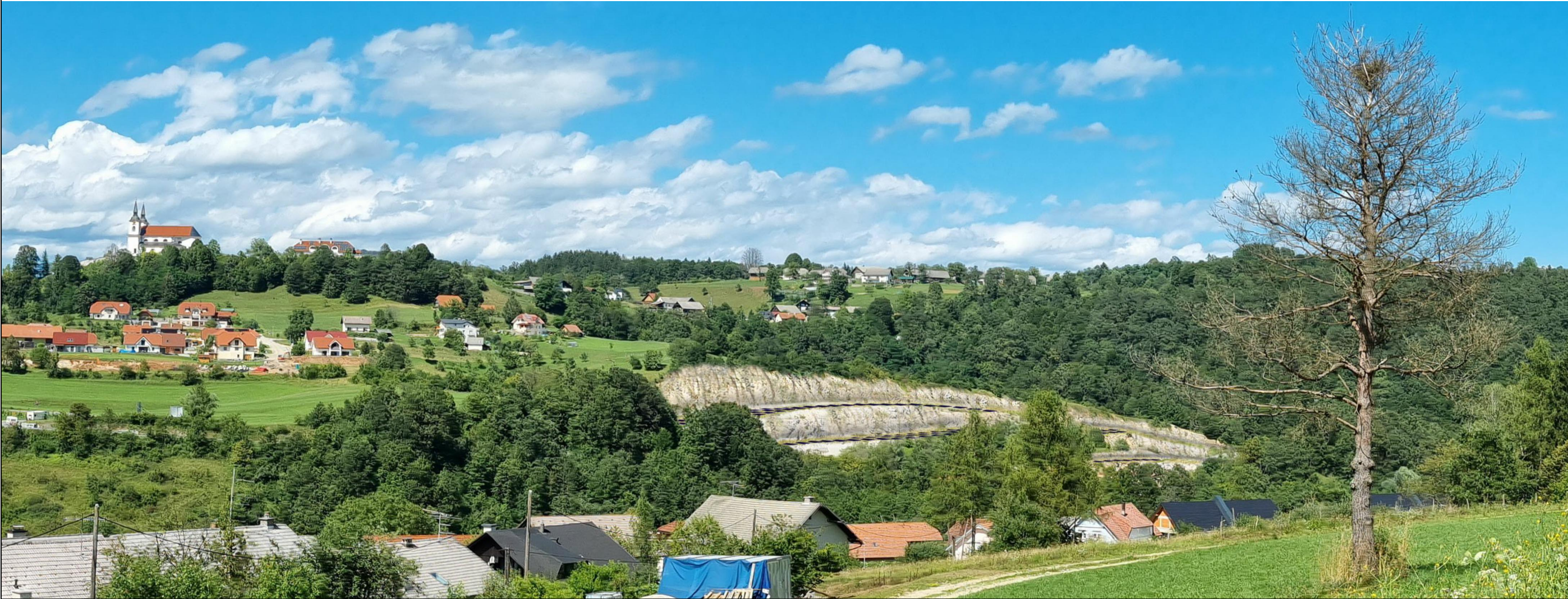
Pogled 3 - Vizualizacija predlaganih rešitev izpred cerkve sv. Roka nad Stransko vasjo (oddaljenost približno 700 m) na desnem bregu Krke. Pogled na sončno elektrarno od daleč.